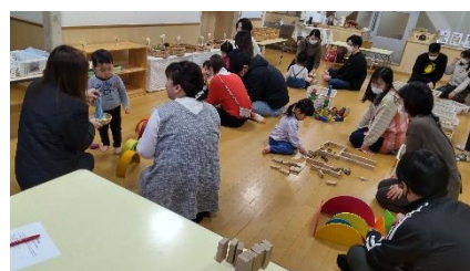
左) 子育て講座の様子 右) 小学生カルタ大会